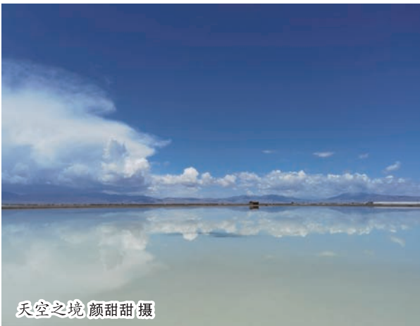
天空之境

走下小桥步入中街,踏上青石板铺成的街道,凹凸不平。站立路中,侧耳倾听,仿佛整个小镇还在沉睡,和刚刚在城区的节奏完全错开。一排排整齐的房屋,白墙黛瓦,偶有三两白发老妪提着菜篮,行走于石板路两侧,对比这千年镇落,她们又好似少女,诉说着这里的生活。渐渐地,置身于此的我们,仿佛有了归属感。