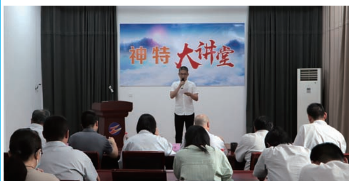
为了进一步锻炼管理人员“说、写、做”能力,6月22日下午,神特新材料公司举办首期“神特大讲堂”,7名中层管理人员联系个人思想和工作实际,谈认识、谈感悟、谈思路、谈对策、谈措施,切实彰显新时代国企干部担当精神和“主人翁”风采。(神特 宣)