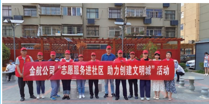
为积极参与港城深化全国文明城市创建工作,进一步发挥党员先锋模范作用,金航资产经营公司积极开展“党建+志愿服务”,与巨龙社区结对开展系列志愿服务活动,助力社区文明和社区环境提升,为文明城市创建助力添彩。(卢新全)

抓育“劳”提升“执行力”。开展“大干二季度”劳动竞赛,对考核中涉及保洁、绿化、市政等12个问题及时进行反馈,跟踪解决落实。深入推进“四带一提”工作,将工会“安康驿站”“红色驿站”和安全班组组合而为一,资源共享;8对师徒签订协议书,进一步强化基层班组长及其后备人才队伍的培养。(陈健 刘凡榕)