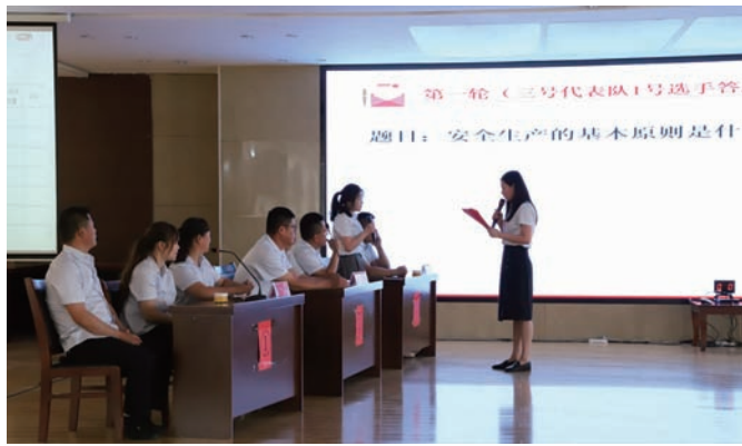
为深入开展“遵守安全生产法，当好第一责任人”全国第21个“安全生产月”活动，6月27日下午，灌西投资公司举办“安康杯”知识竞赛，来自各单位的6支代表队在必答、抢答三个环节中展开角逐，通过以赛促学，进一步提高全员安全意识。(杨美娟)