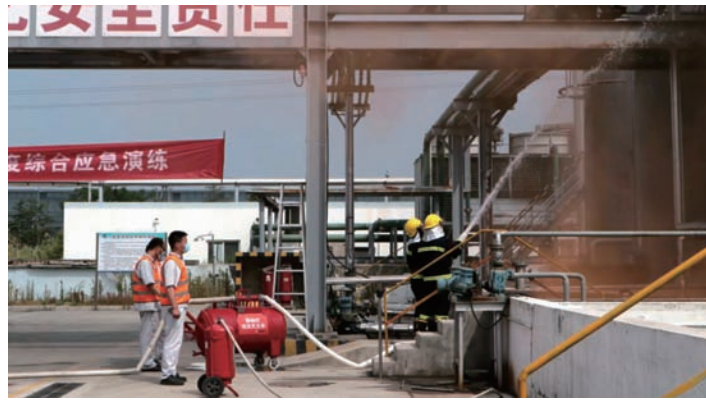
为贯彻落实安全生产月“安全第一、预防为主、综合治理”的安全生产方针，6月21日上午，神特新材料公司以遏制重特大安全事故为目标，组织开展2022年度综合应急演练活动，进一步增强全员应急意识，提高事故应急处置能力。(神特宣)

后勤保障服务到位。该公司工会开展“送清凉”活动，为一线职工送西瓜、矿泉水等防暑降温物品，为各个休息点配发常用药品急救箱，处处体现工会“娘家人”的贴心关怀。该公司安全部开展“进一线、送安全”活动，按照流程及时采购藿香正气水、人丹、风油精等夏季防暑降温药品，及时送到各班组、各岗位。科学对作息时间进行调整，避开高温时段作业，切实保障职工身体健康。(陈健 陈蓓蓓)